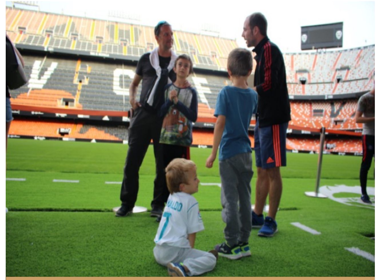
STADE MESTALLA (VALENCIA CF) OU/ ET STADE DE LA CUITAT DE VALENCIA (LEVANTE)