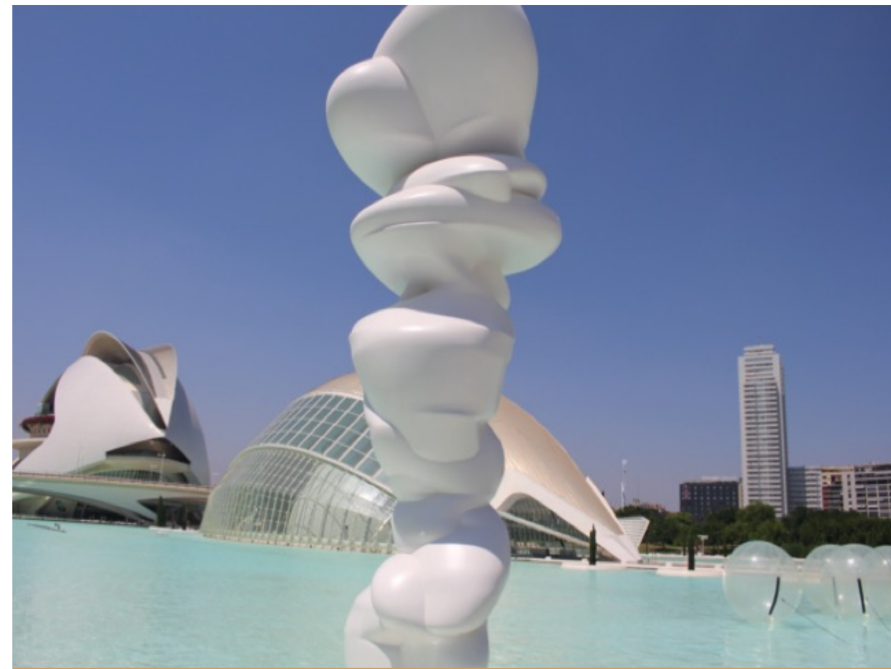
CITE DES SCIENCES